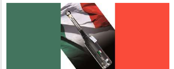
IL TRICOLORE NELLA GRAPPA In un momento di massima unità degli ita...