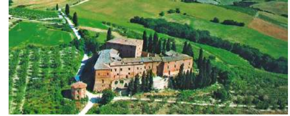
CASTELLO IN VENDITA, A MONTALCINO Situato in eccezionale posizione ...